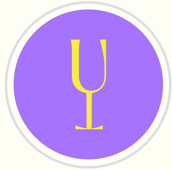
Vin sur Vin